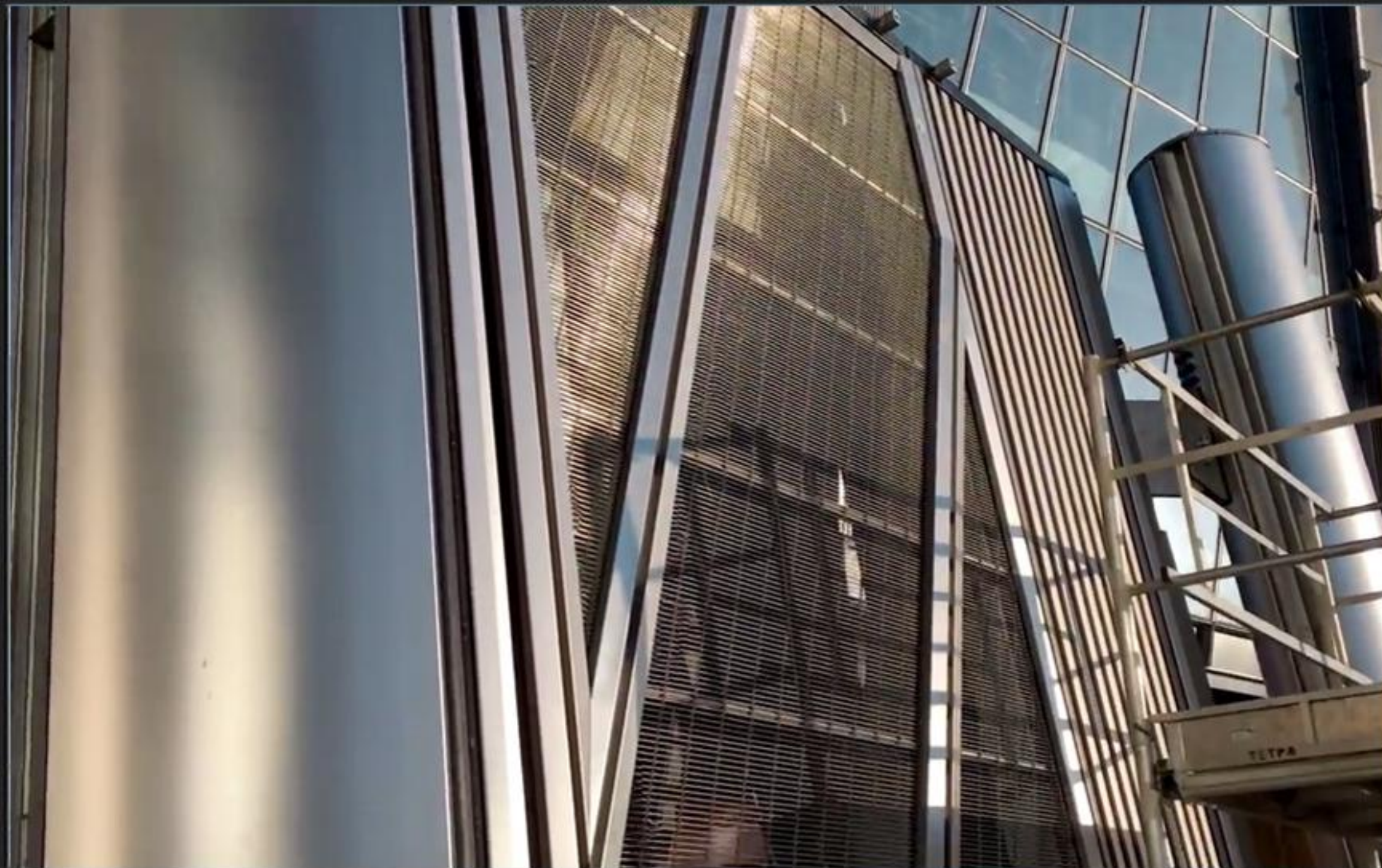
Санкт-Петербург, Россия, Лахта Центр, направляющие системы обслуживания фасадов, нержавеющий лист 2 мм, марка стали 316L, струйная обработка EG3 - выполнен Design Factory