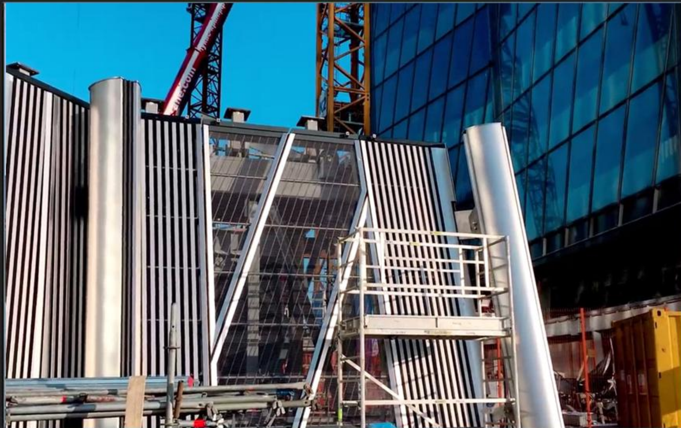
Санкт-Петербург, Россия, Лахта Центр, направляющие системы обслуживания фасадов, нержавеющий лист 2 мм, марка стали 316L, струйная обработка EG3 - выполнен Design Factory