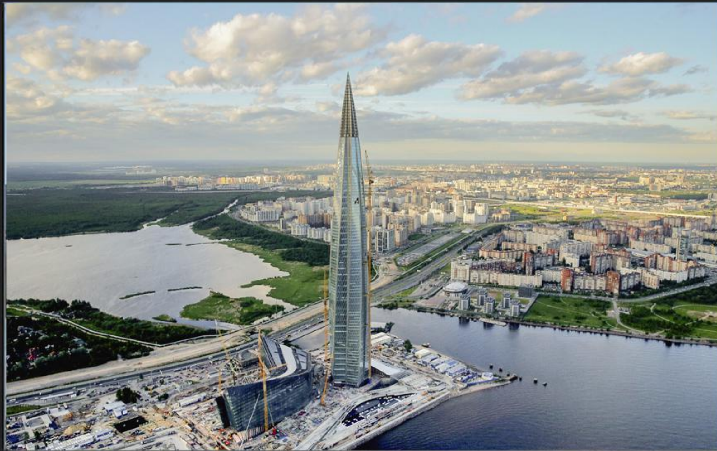
Санкт-Петербург, Россия, Лахта Центр, направляющие системы обслуживания фасадов, нержавеющий лист 2 мм, марка стали 316L, струйная обработка EG3 - выполнен Design Factory